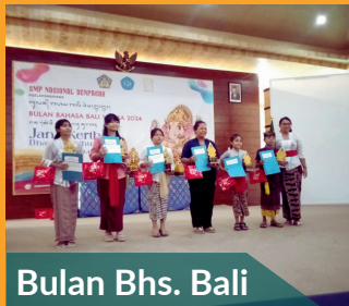
Bulan Bhs. Bali